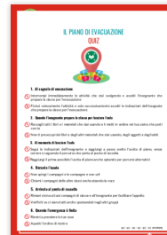
Il piano di evacuazione - Quiz